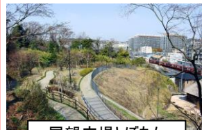
展望広場とぼたん