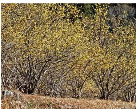
土佐原休憩施設とロウバイ