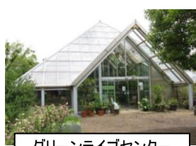
グリーンライブセンター