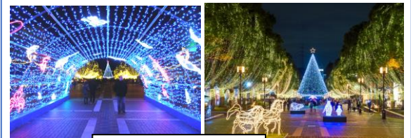
イルミネーション