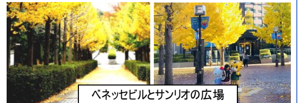
ベネッセビルとサンリオの広場

ベネッセビルとサンリオピューロランドの間の広場は銀杏並木が広がっています。この時期は黄色く落ち葉も素晴らしいことを願っています。