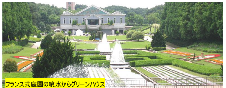
フランス式庭園の噴水からグリーンハウス

相模原公園内は①フランス式庭園②サカタのタネ「グリーンハウス」が主な見所でしょう。フランス式庭園は噴水と季節の花壇です。グリーンハウス内は温室もあり、熱帯植物や緑と花の楽園となっています。