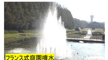
フランス式庭園噴水