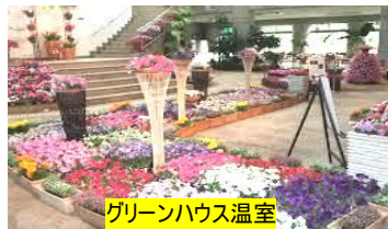
グリーンハウス温室