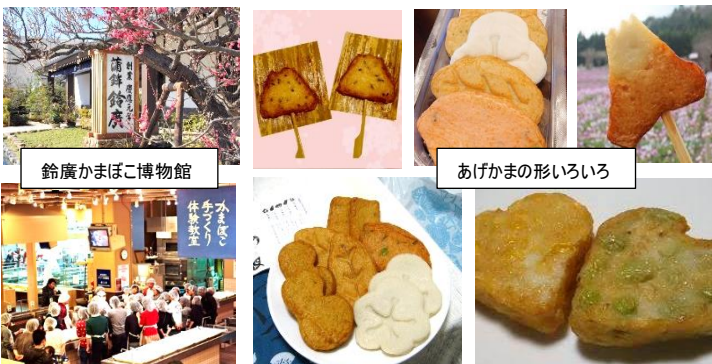
鈴廣かまぼこ博物館

かまぼこの歴史や不思議、素材や栄養のことなど楽しみながら学べます。ガラスごしにかまぼこ職人たちの技を間近で見られますが、今回はあげかまづくりの体験を行います。体験時間は15:00~15:30と短ですが、あげかまの形は皆さんがいろいろと工夫されてオリジナルテイ溢れるものを期待しています。